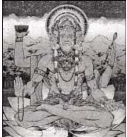
తదద్య, దినమాన వర్షేశ్వరహా అని చెప్పబడింది.

'సృష్ట్యాదౌ బ్రహ్మణా క్రంతి వుత్తరేవతి యోగతారాసన్న ప్రదేసే సర్వగ్రహణం నివేశితత్వాత్త దవధితో గ్రహచలాత్ సృష్టిదౌ అర్హవార సద్భవత్